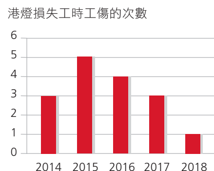
圖7 – 安全統計數字 (2014-2018)

港燈一直保持良好的安全表現，歷年來的意外比率均遠低於業界。圖表顯示了2014-18年間，港燈的損失工時工傷統計數字（圖7），以及港燈的損失工時工傷發生率與香港職業傷亡率比較（圖8）。