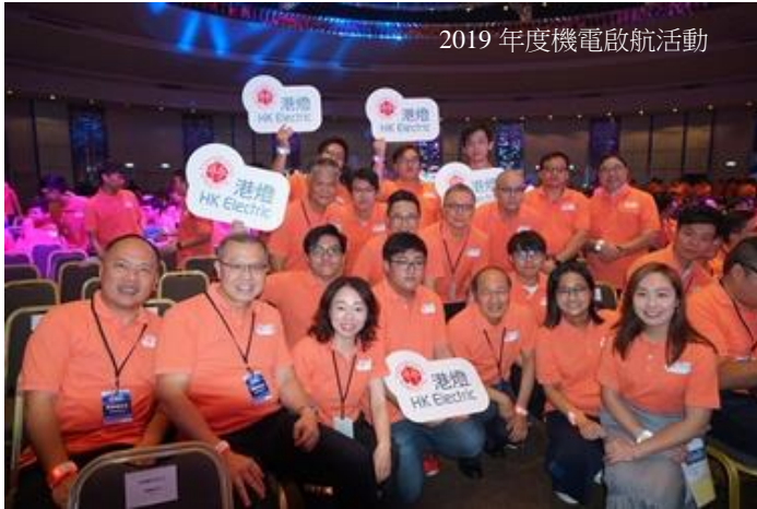
2019 年度機電啟航活動