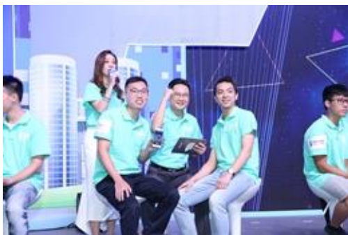
技術服務主管與二級見習技術員，代表公司參與公開活動。

底薪另加約滿酬金、年終特別獎金、醫療福利、有薪年假、考試假期、學費津貼及電力津貼(如適用)