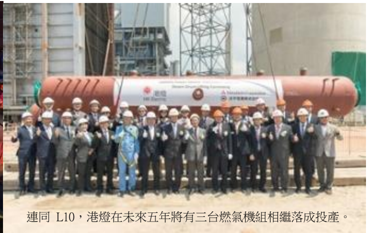
連同 L10，港燈在未來五年將有三台燃氣機組相繼落成投產。