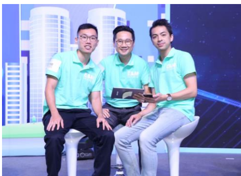
技術服務主管與二級見習技術員，代表公司參與公開活動。

底薪另加約滿酬金、年終特別獎金、醫療福利、有薪年假、考試假期、學費津貼及電力津貼(如適用)