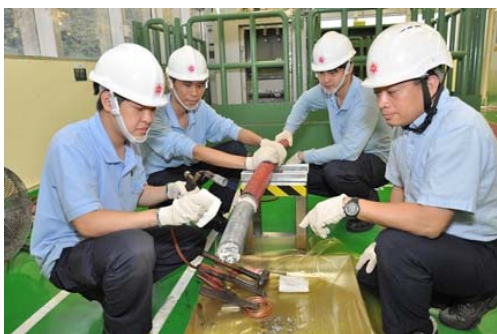
上圖為我們的二級見習技術員於工場實習的情況。

底薪另加約滿酬金、年終特別獎金、醫療福利、有薪年假、考試假期、學費津貼及電力津貼(如適用)