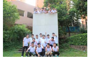
我們的見習生，攝於畢業訓練營。