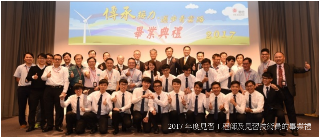
我們的見習生，攝於畢業訓練營。