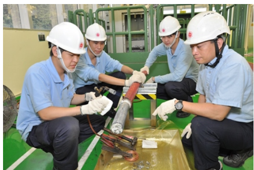
上圖為我們的二級見習技術員於工場實習的情況。

底薪另加約滿酬金、年終特別獎金、醫療福利、有薪年假、考試假期、學費津貼及電力津貼(如適用)