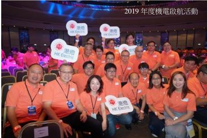
2019 年度機電啟航活動