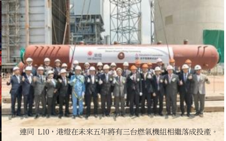
連同 L10，港燈在未來五年將有三台燃氣機組相繼落成投產。